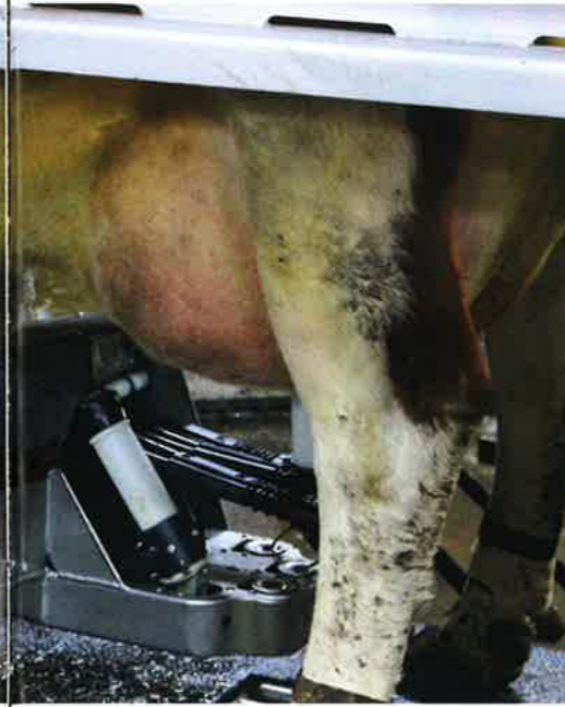
lypsyn. Robotti vaatii ajoittain myös huoltoja ja