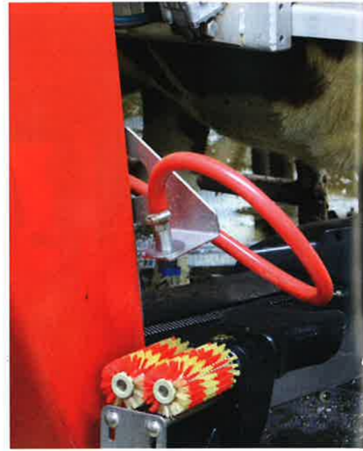
Lypsyrobotti pesee itse itsensä aina ennen ja jälkeen nännikumit tulee vaihtaa säännöllisesti.