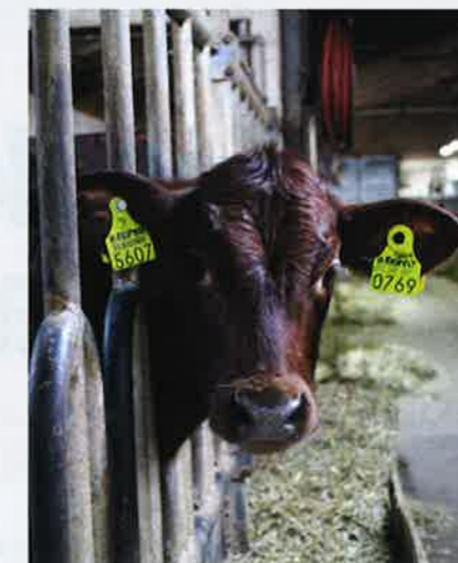
MaitoLandia Oy sai erittäin hyvät pisteet Biocheck-analysissä muun muassa vasikka- ja lypsypuolelta, koska eläimet on jaoteltu ikäryhmittäin.

Lypsykarjan strateginen terveydenhuolto – karjan terveys talouden kilpailutekijänä, tutummin Terve karja kannattaa -hanke pyrkii parantamaan maitotilojen taloudellista tulosta kohottamalla ennaltaehkäisevän terveydenhuollon osaksi maitotilojen toimintaa. Tavoitteena on muun muassa saada käyttöön mahdollisimman yksiselitteiset tautisuojaus- ja bioturvaohjeet tilan sisäiseen ja ulkoiseen tautisuojaukseen. Esimerkiksi